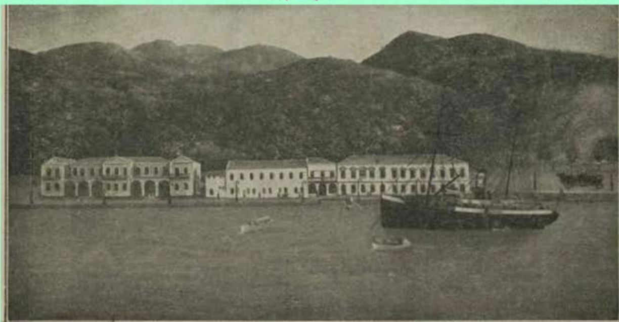
ΝΑΤΡΟ-ΧΛΩΡΙΟ-ΘΕΙΟΥΧΑ ΦΥΣΙΚΑ ΙΑΜΑΤΙΚΑ ΛΟΥΤΡΑ ΜΑΝΔΡΑΚΙΟΥ - ΝΙΣΥΡΟΥ

Ετοιχεία ίδιου ταξιδιού στον χρόνο με ιδροαριμό τη γνή