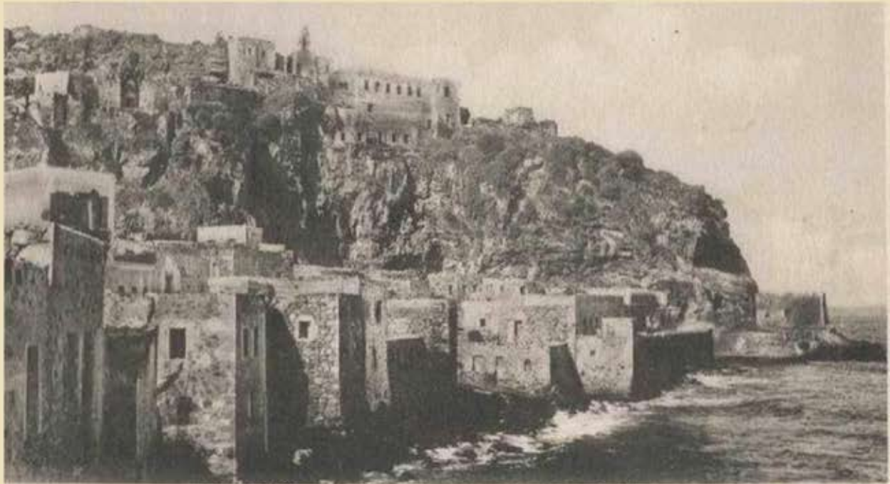
NISIRO (Eggo). - Porto Vecchio e Monastero Spiliani

Μετ' στους καρπούς το κύμα εμήλεψε την ιώλη